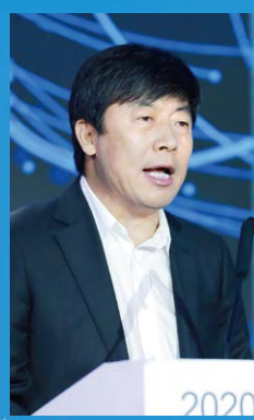
陕西省文化和旅游厅副厅长陈梦楠：

“用好数字技术、讲好‘陕西故事’、擦亮陕西‘文化名片’，为陕西文旅产业发展增添新动能，增加科技活力，为新时代全面建设经济强省和推动高质量发展提供有力支撑。”