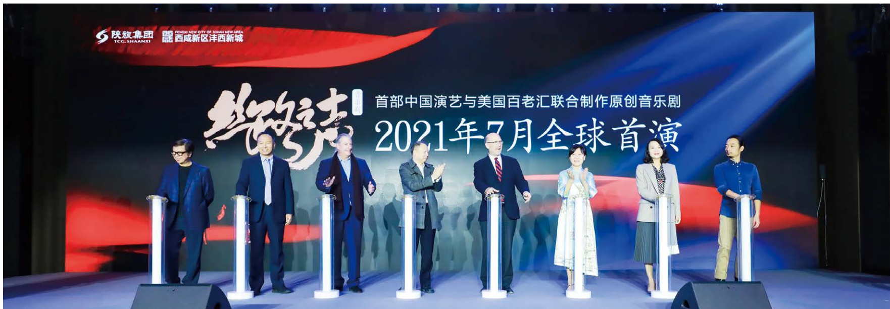
2020年10月30日，由陕西旅游集团有限公司与美国百老汇倪德伦环球娱乐公司倾力打造的中国第一部以“丝绸之路”为主题的音乐剧《丝路之声》全球首演发布会在北京成功举办。这是陕旅怀抱文化自觉，倾听历史回响，促进文化对话的一次不同寻常的大胆尝试。