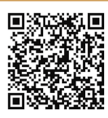
扫码看莫言在壶口讲述黄河